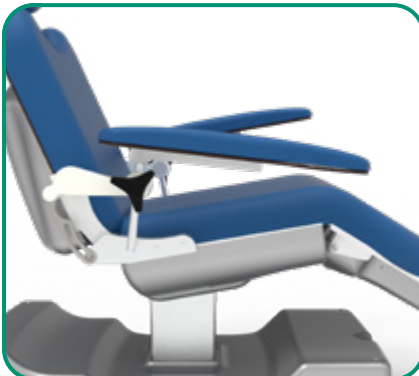
■ FIG. 7 - INCLINABILI