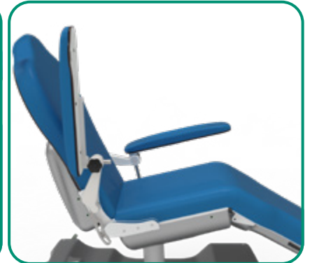
■ FIG. 6 - RIBALTABILE INGRESSO FACILITATO