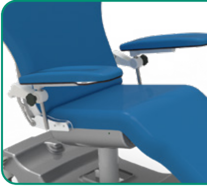
■ FIG. 1/2 - MOVIMENTO SOLIDALE ALLO SCHIENALE