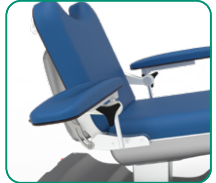
■ FIG. 3 - GIREVOLE