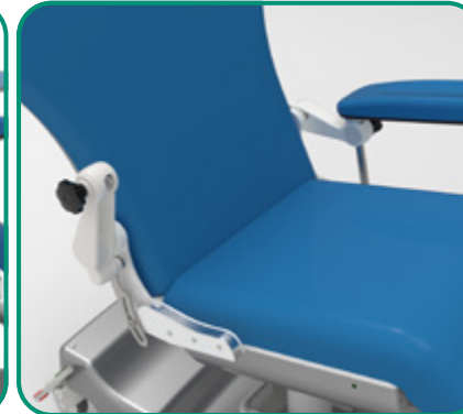
■ FIG. 5 - ASPORTABILE