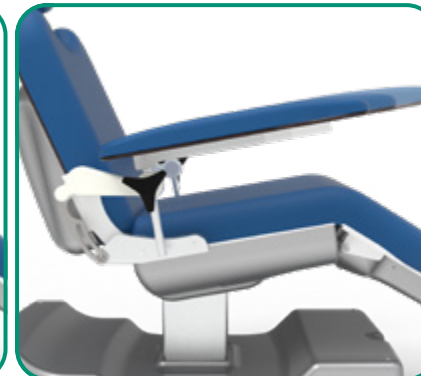
■ FIG. 8 - SCORREVOLE ORIZZONTALMENTE