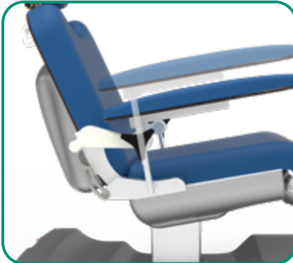
■ FIG. 4 - REGOLAZIONE ALTEZZA