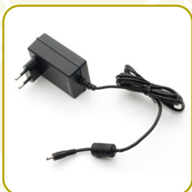
ALIMENTATORE IN DOTAZIONE