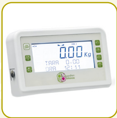
DISPLAY AD ELEVATA VISIBILITÀ DOTATO DI BATTERIA RICARICABILE, AUTONOMIA DI CIRCA 16 ORE