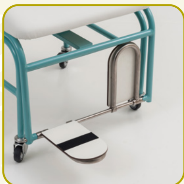
POGGIAPIEDI IN A RIBALTA