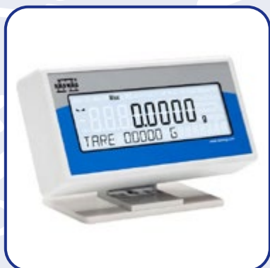
DISPLAY LCD WD-6 LCD

Display supplementare costruito in tecnopolimero. Completo di supporto da tavolo e cavo seriale per collegamento alla bilancia. Il display supplementare è orientabile e quindi permette di mostrare i risultati anche a distanza dalla postazione di lavoro.