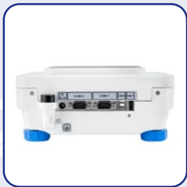
PORTE DI COMUNICAZIONE PER LA TRASMISSIONE DEI DATI