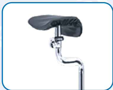
REGGICOSCIA REGOLABILI ED ORIENTABILI