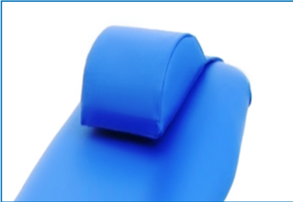
Poggiatesta regolabile e rimovibile