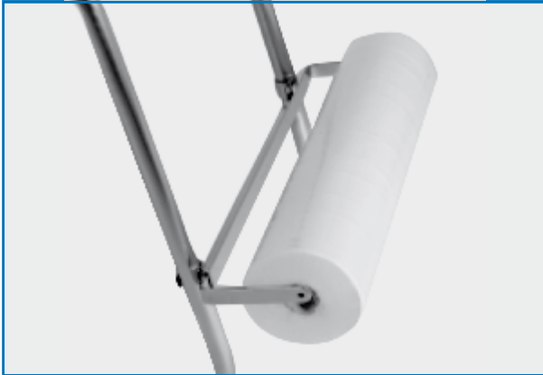
Portarotoli integrato in acciaio cromato