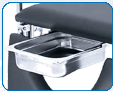
VASCHETTA INOX ESTRAIBILE