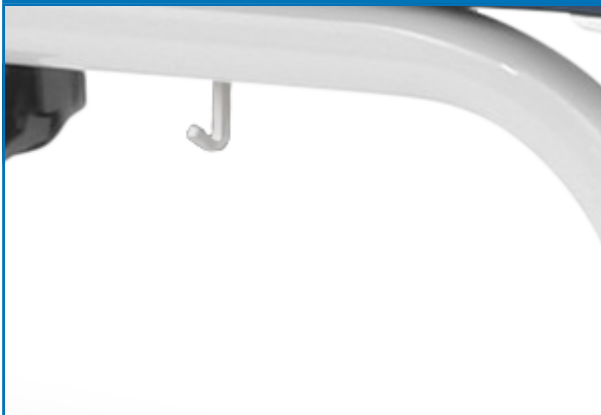
Gancio supporto per sacca drenaggio