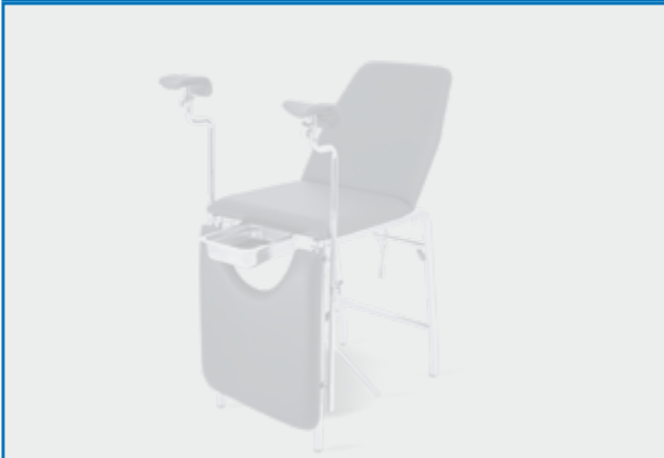
Morsetto e canotto diametro 25 mm per asta