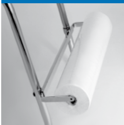
Portarotoli per lettino in acciaio cromato.