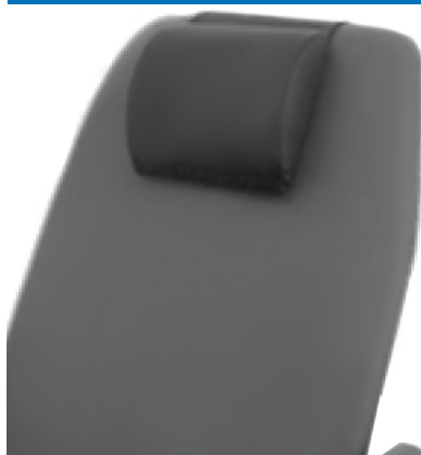
Poggiatesta rimovibile strap velcro.