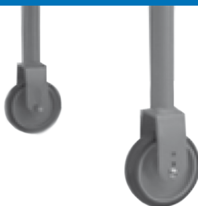
Kit con 4 ruote diametro 100 mm (due con freno).