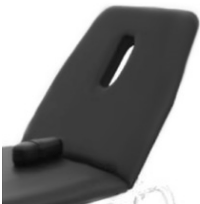
Foro su testiera per lettino.