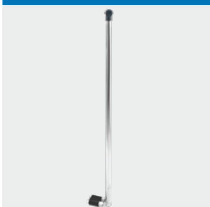
Alloggiamento fisso per asta portaflebo diametro 18-22 mm.