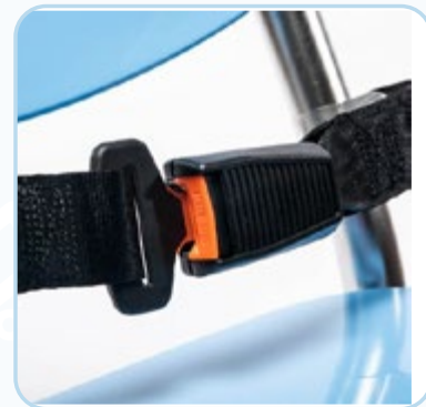
CINTURA DI SICUREZZA, CON SISTEMA SGANCIO RAPIDO