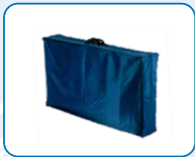
CUSTODIA IN DOTAZIONE