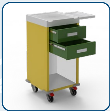
CASSETTO LATERALE A SCOMPARSA