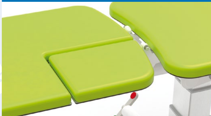
Piano con sezione removibile.