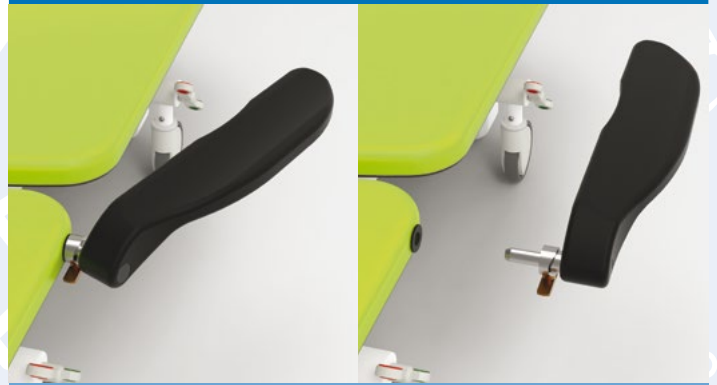
Braccioli anatomici in gomma poliuretana con anima in metallo. Seguono il movimento dello schienale. Sono ribaltabili per favorire l'accesso laterale. Completamente removibili per facilitare il trasferimento del paziente su un altro dispositivo. La regolazione esterna agevola la fase dell'anestesia.