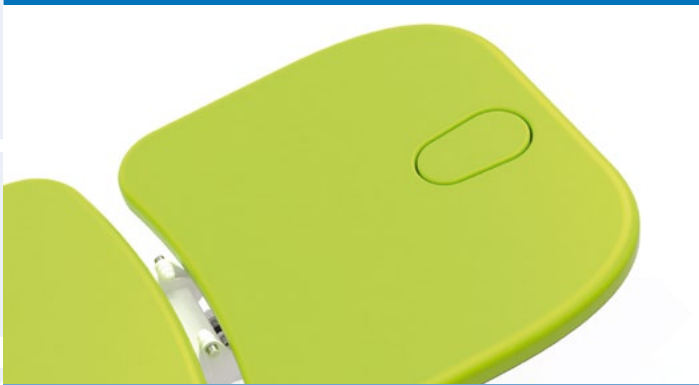
Sezione schienale con foro facciale.