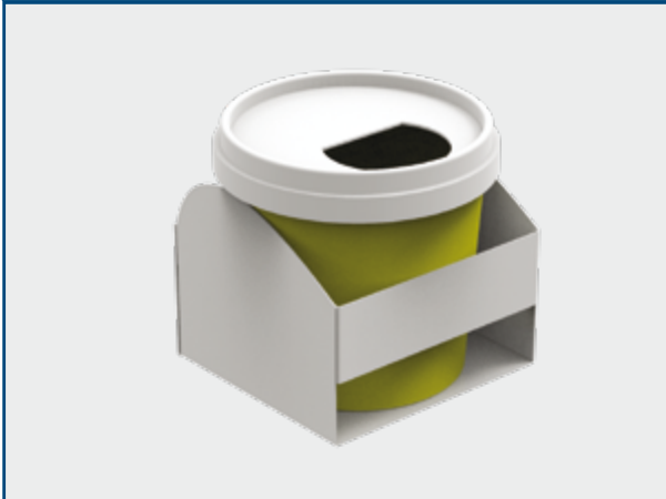
Récipient pour tranchants