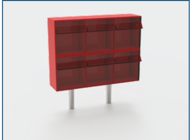
Commode modulaire à 6 tiroirs