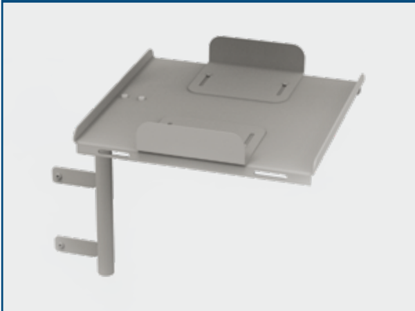
Plan de support défibrillateur/moniteur