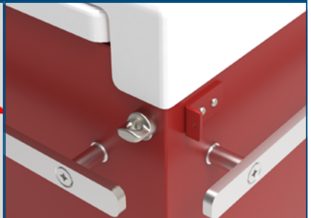
Fermeture centralisée pouvant être scellée