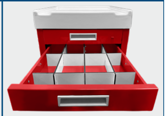
Kit diviseurs de tiroirs : ACCF15/1 - 10 compartiments ; ACCF15/2 - 15 compartiments ; ACCF15/3 - 20 compartiments ; ACCF15/4 - 25 compartiments