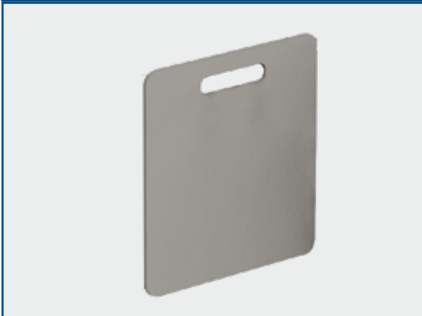
Planche de massage cardiaque