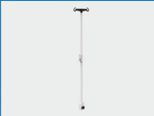
Perche à perfusion