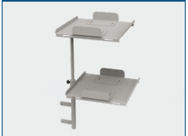
Double Plan de support défibrillateur/moniteur