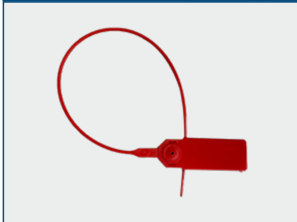
Scellé de sécurité jetable non numéroté