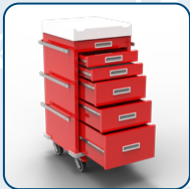
TIROIR LATÉRAL ESCAMOTABLE