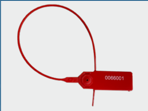
Scellé de sécurité jetable numéroté