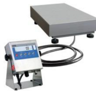
WPT 3H1/K Versione con colonna