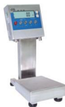
WPT 3H1 Versione con colonna