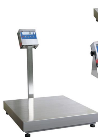
WPT H Versione con colonna